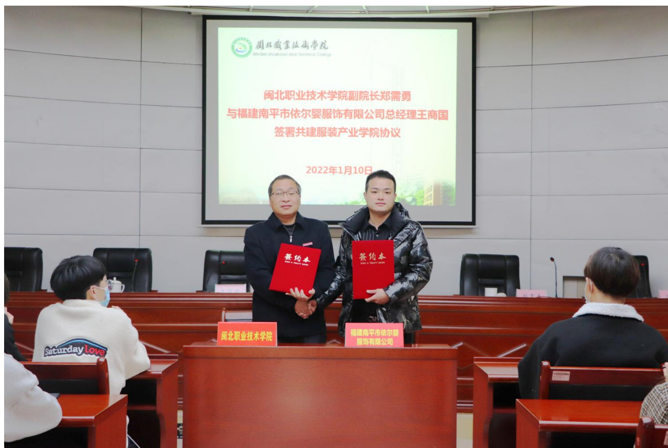
图 1 闽北职业技术学院和福建南平市依尔婴服饰有限公司签约现场

深化产教结合，以满足闽北经济社会的发展需求，推动教育改革，促进职业教育和产业的联合发展，共同培育服装与服饰设计领域的专业技术人才。学院积极扩大与行业和企业联系，强化人才培养、实训基地、教师团队和社会服务等各方面的建设，与企业协作进行技术研发、提供技术服务和职业培训，以增强其为产业发展提供服务的能力。福建南平市依尔婴服饰有限公司则将充分利用其在产业和技术方面的积累优势，与学院在人才培养模式创新、师资互聘共用、社会服务平台建设等方面进行深度合作，共同谋求发展。