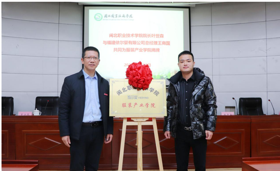
图 2 服装产业学院揭牌