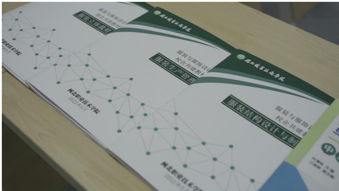
图 13 赛教融合项目化教学过程

结合当前服装生产智能装备制造的新知识、新技术、新工艺、新标准，实现“课程内容与职业标准对接”，校企计划共建《服装生产管理》、《成衣样板设计与制作（童装篇）》等专业基础与专业核心课程的教材与课程教学网络资源，编制《成衣样板设计与制作（童装篇）实训指导书》、《智能吊挂系统实训操作手册》等实用型技术手册和实训指导书。