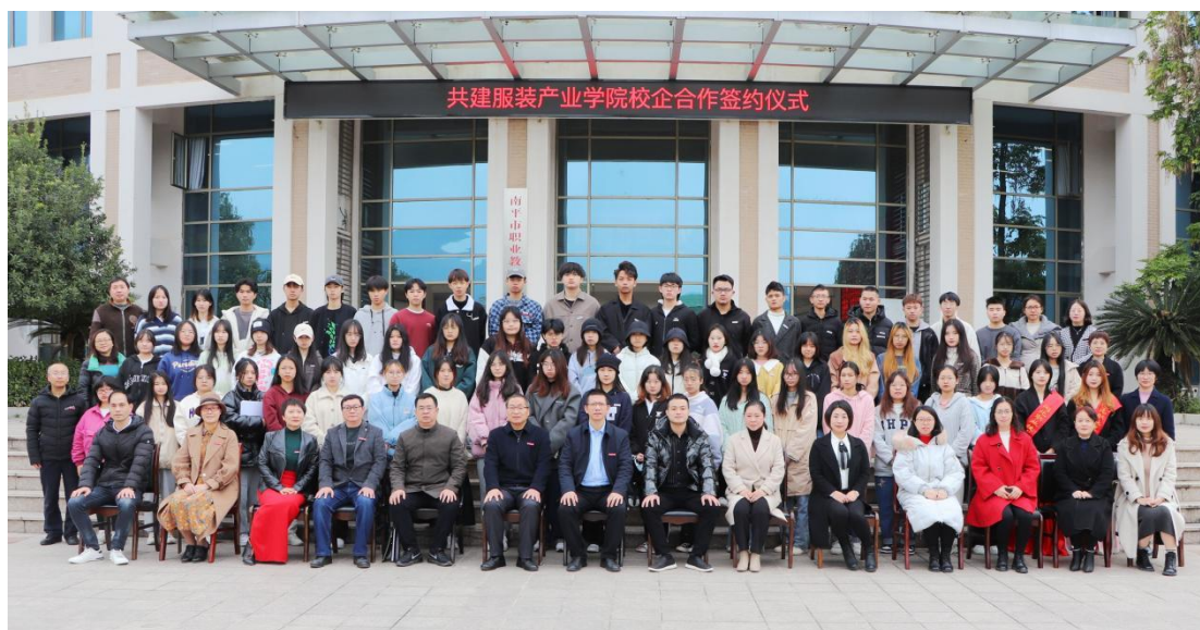
图 3 服装产业学院成立仪式合影