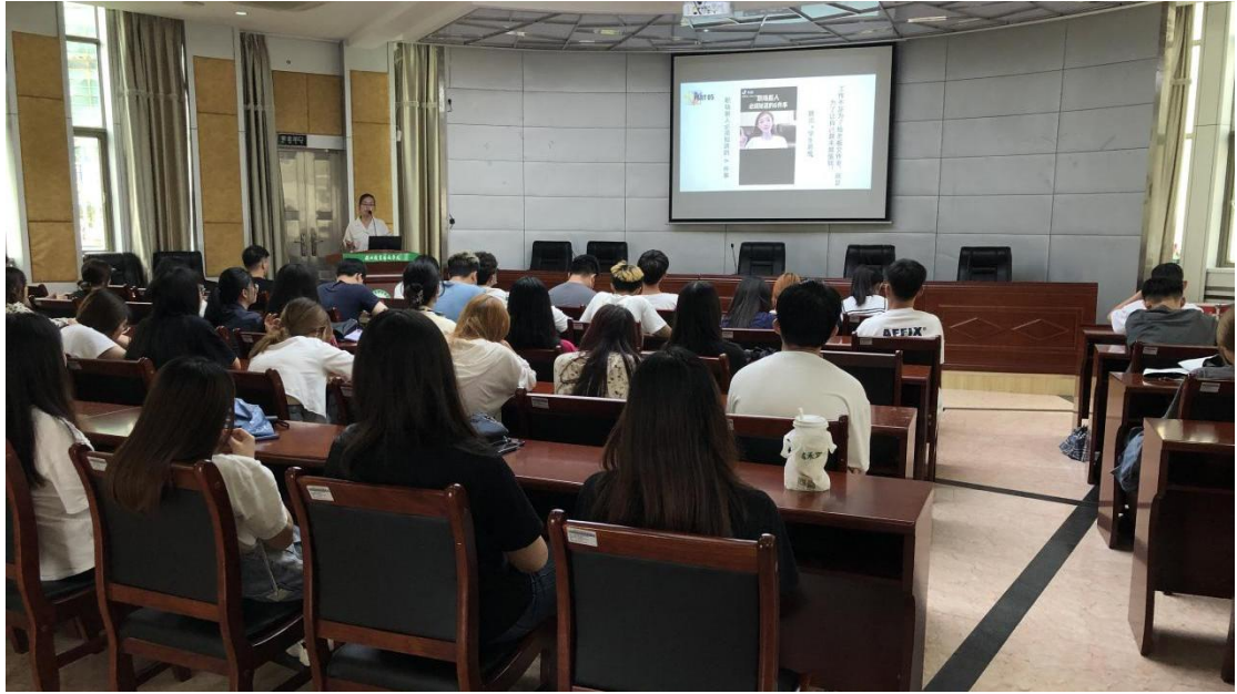
图 6 企业导师讲授职业生涯规划