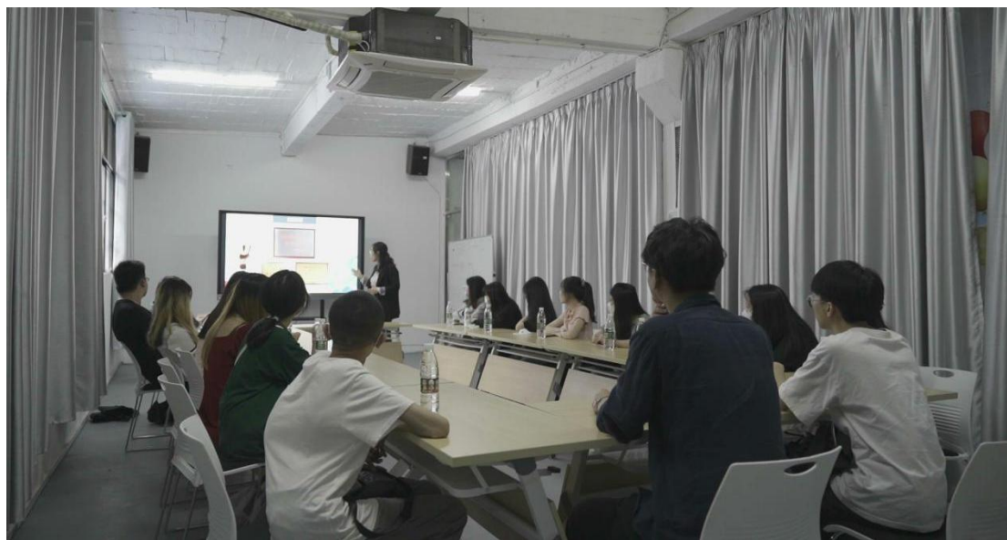
图 4 服装产业学院班师生校企交流活动

企业参与实训基地建设，投入设备和资金改善实训环境。校企共建校内服装产业学院实训基地，校企共建校外实践教学基地，为学生实训实习搭建良好的平台。