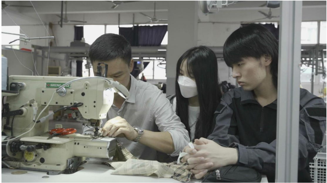
图 8 企业导师演示工艺制作课程