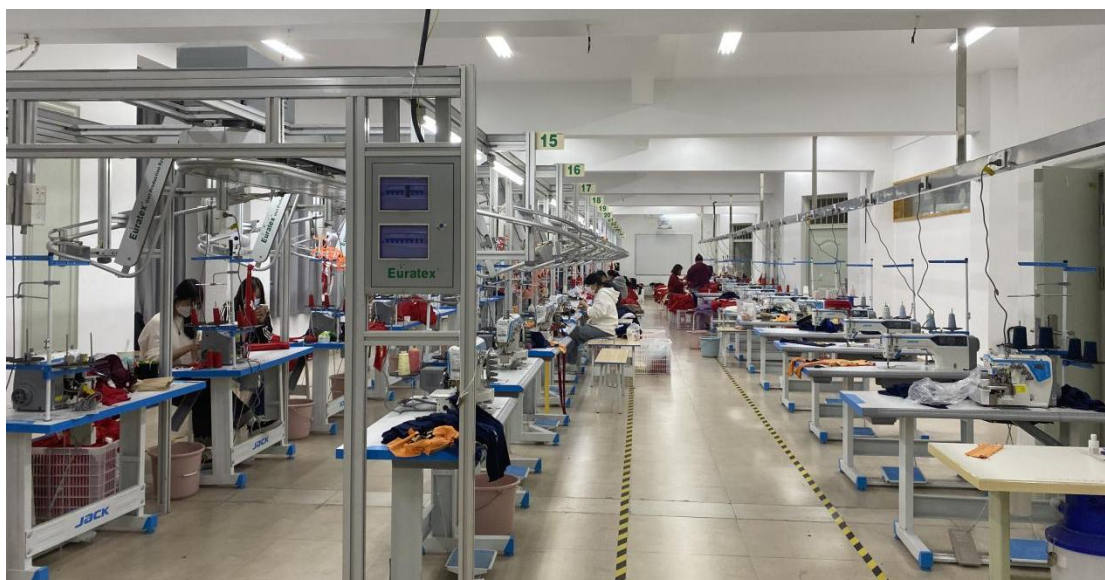
图 5 服装产业学院班校内实训基地