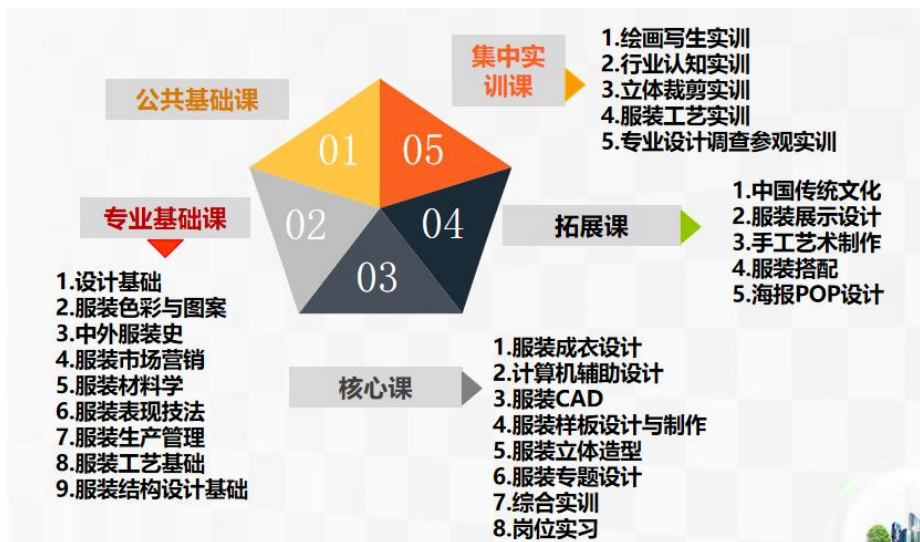
图 10 “稳基础、活模块、重实践”课程体系