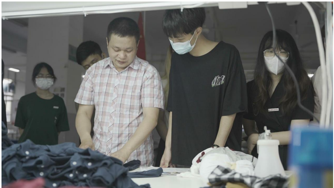
图 7 企业导师讲授产品质检课程