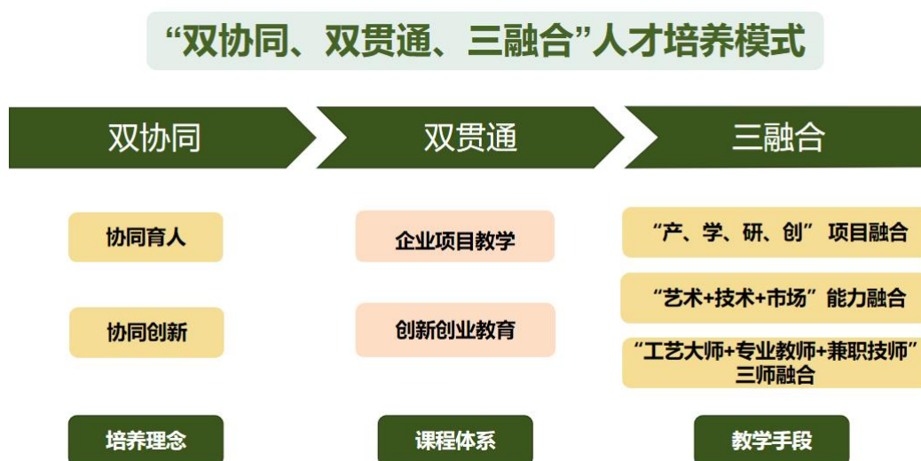
图 9 人才培养模式

培养需要。依托企业项目，将“工、学、研、创”项目融合，将“课程思政”、“工匠精神”、“文化传承”等综合素质培养有机融入，实现“课岗赛”对接。